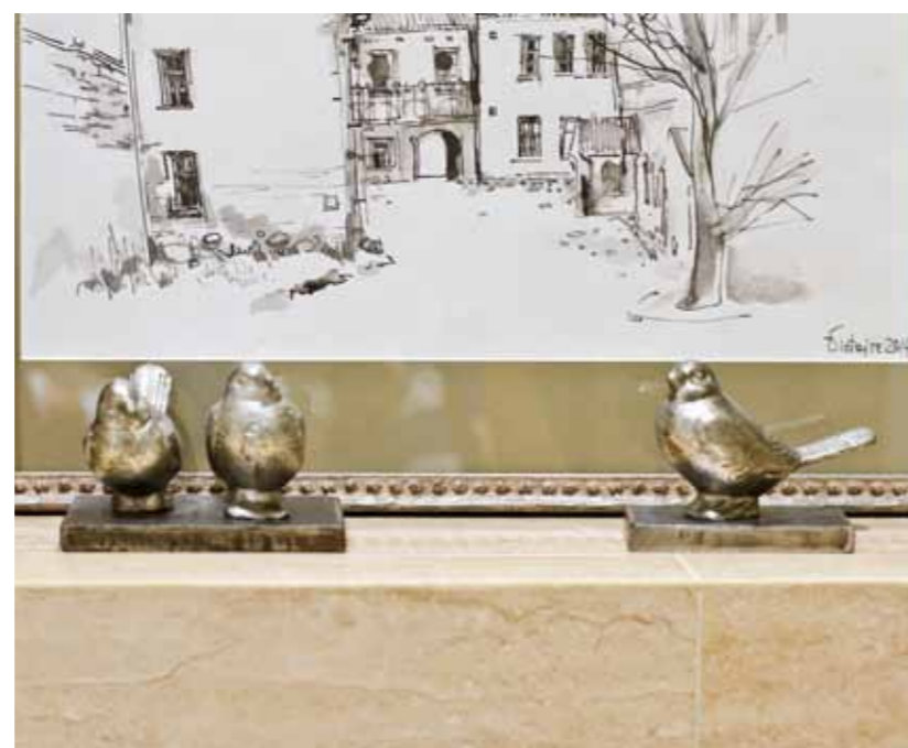
Отдельного внимания заслуживают гравюры известного белорусского графика Петра Яковенко, которыми украшены несколько комнат в доме.

На третьем этаже располагаются комнаты совершенно разные по назначению. Для игровой комнаты внуков был выбран диван-трансформер, в обивке использованы два ярких цвета с разными текстурами. Используя геометрию помещения, был встроен вместительный стеллаж, предназначенный для многочисленных сувениров, привезенных из путешествий. Важная роль в проекте отведена столярным изделиям. В доме нет ни одной комнаты без изделий, выполненных на заказ по авторским эскизам. Именно они стали акцентами в разных помещениях: тумба для ТВ и книжные стеллажи около камина, стеллаж в кабинете и игровой.