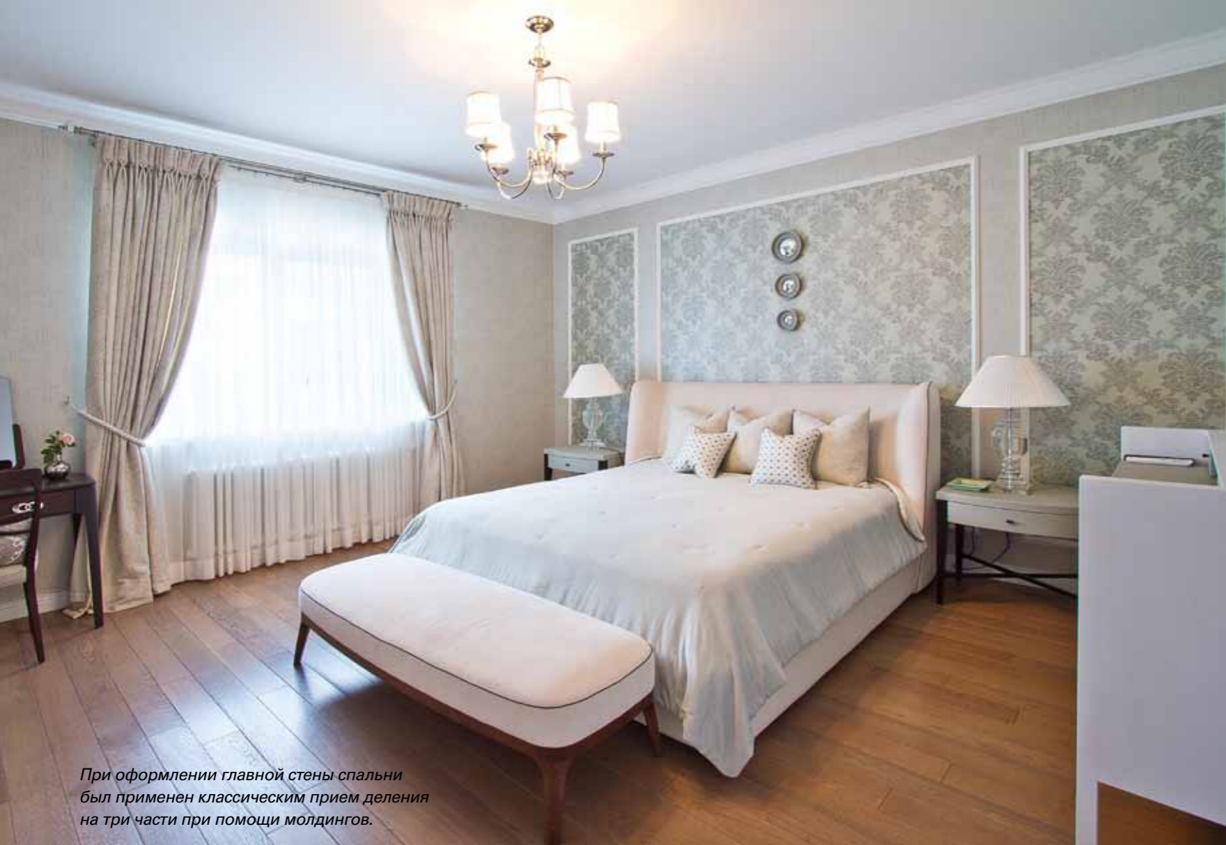
При оформлении главной стены спальни был применен классический прием деления на три части при помощи молдингов.